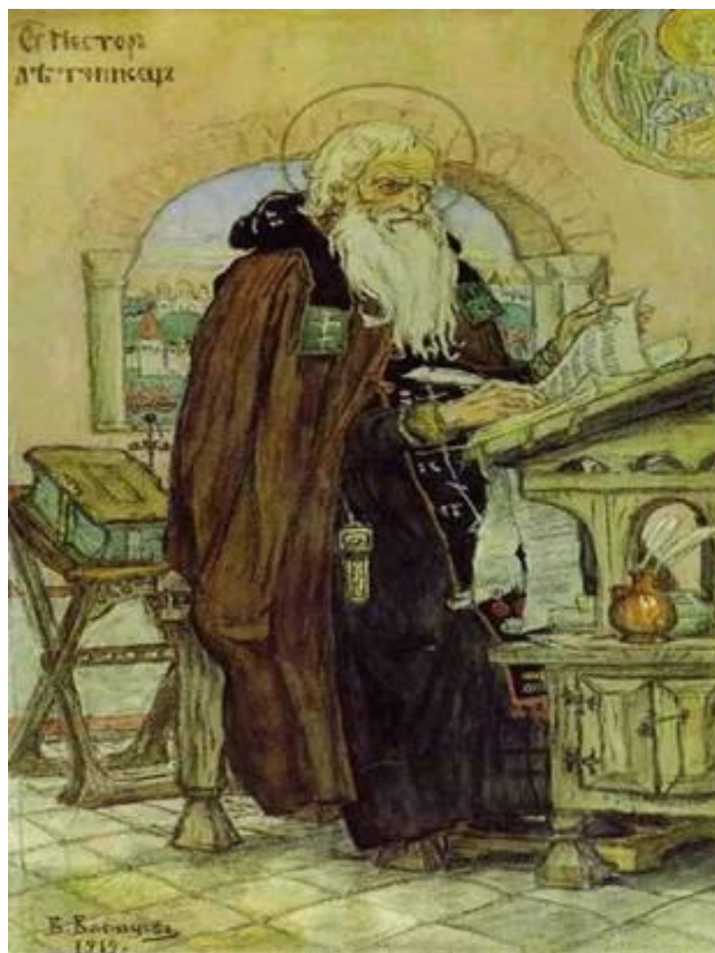
Нестор – монах Киево-Печёрского монастыря, знаменитый летописец