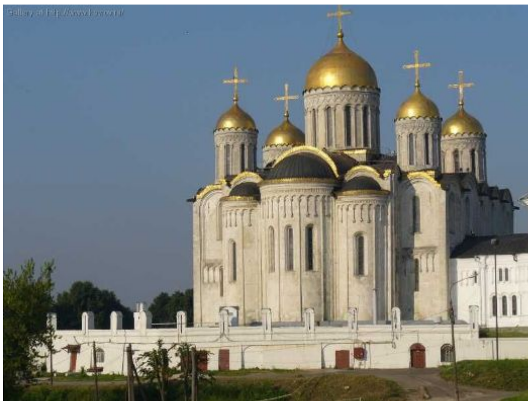
Владимир. Успенский собор.12 век

В городах строятся красивые храмы. Город является центром религиозной жизни Древней Руси.