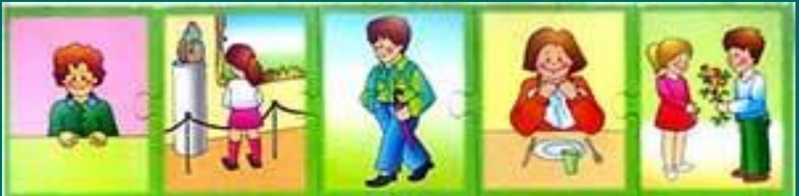
КАК СЛЕДЕТЬ ЗА СТАНОМ