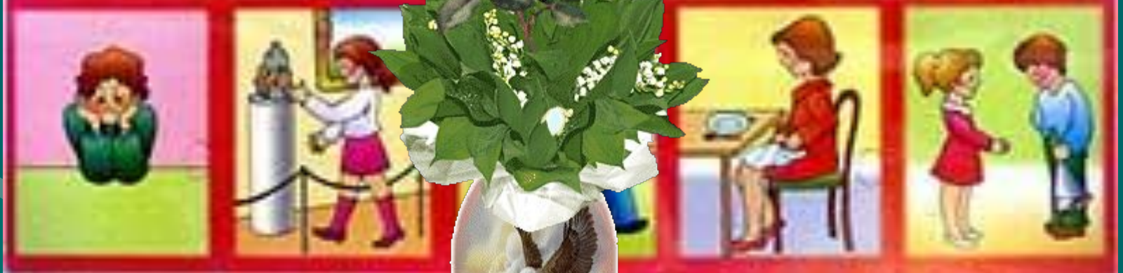
КАК ПРИНЯТЬ ЦВЕТЫ