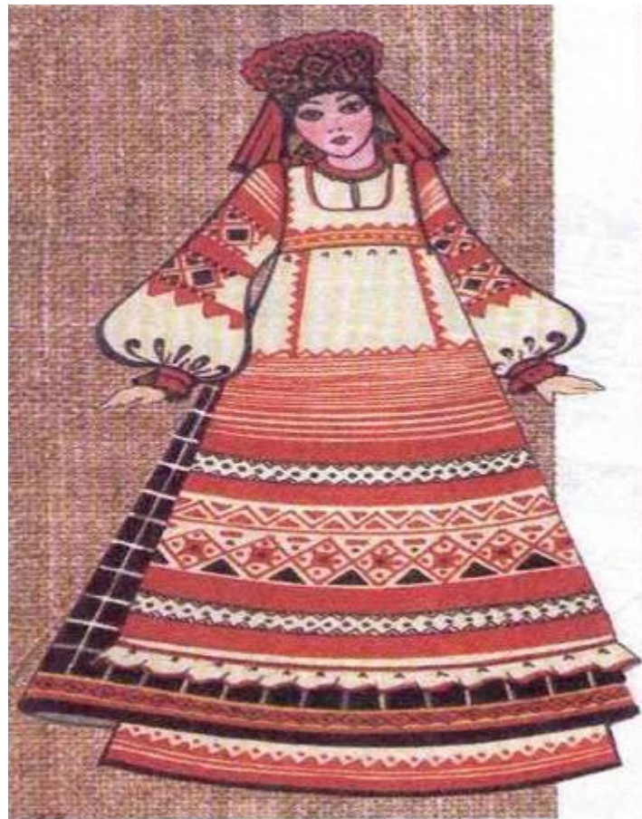
ПРАЗДНИЧНЫЙ ДЕВИЧИЙ КОСТЮМ. (ПЕРЕДНИК)