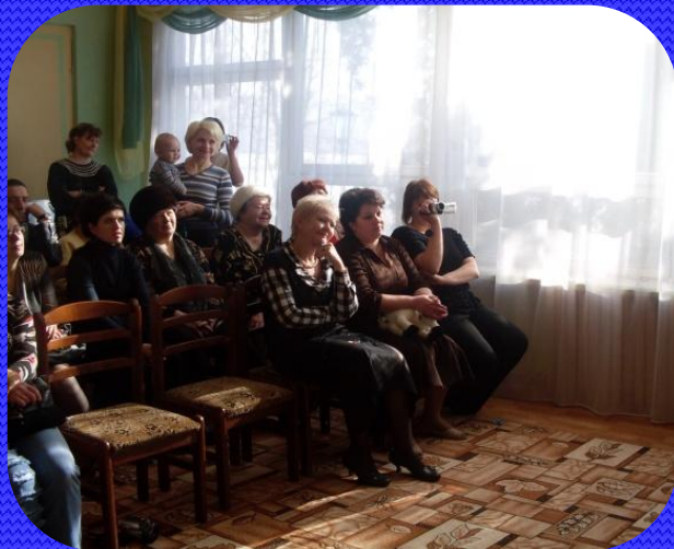
Общие родительские собрания