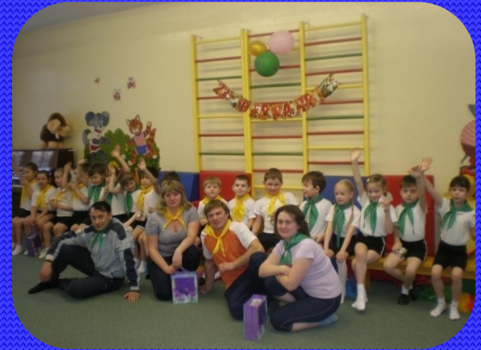
Участие родителей в праздниках