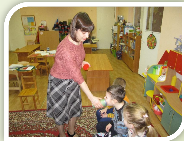
Банка для криков