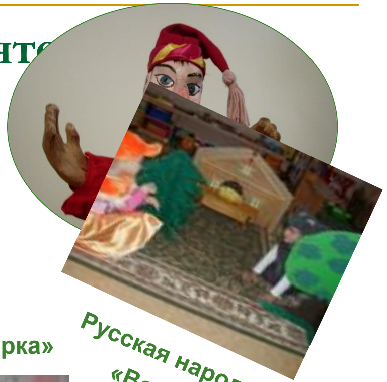
Русская народная сказка «Волк и лиса»