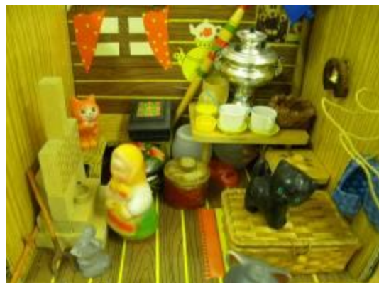
Быт и традиции русского народа