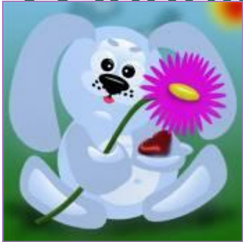
Иллюстрации детской литературы