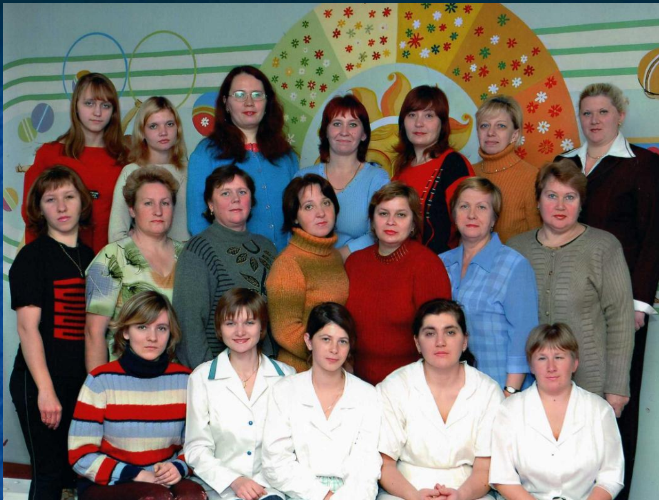
■ Коллектив детского сада №135