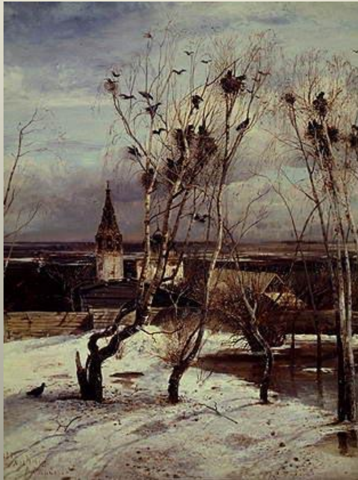
А.К.Саврасов «Грачи прилетели»