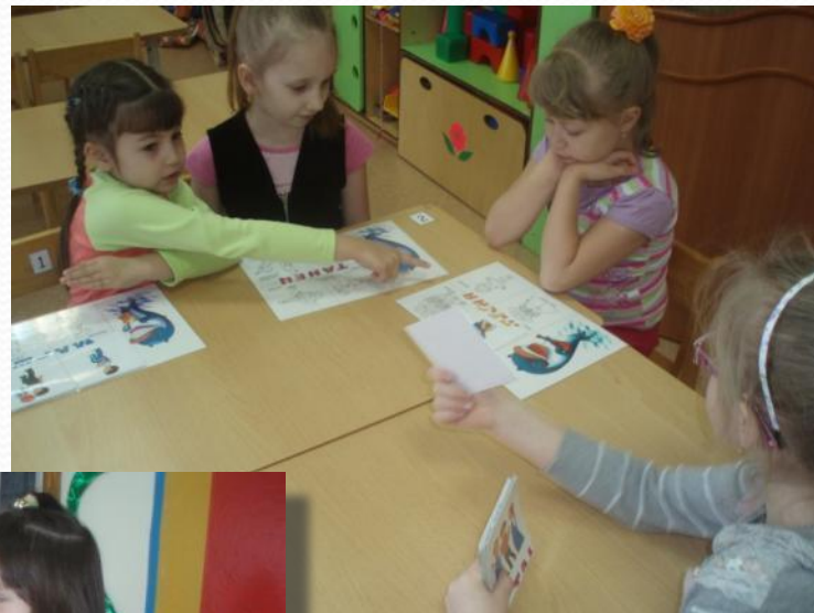
Лото «Три кита»