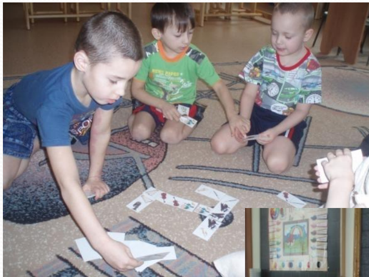
Домино «Инструменты симфонического оркестра»