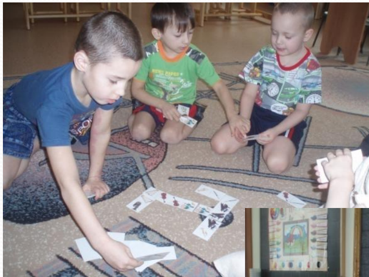
Домино «Инструменты симфонического оркестра»