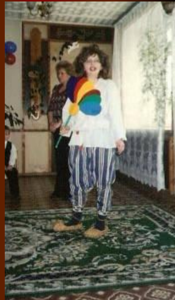
...и Домовёнок Кузя...