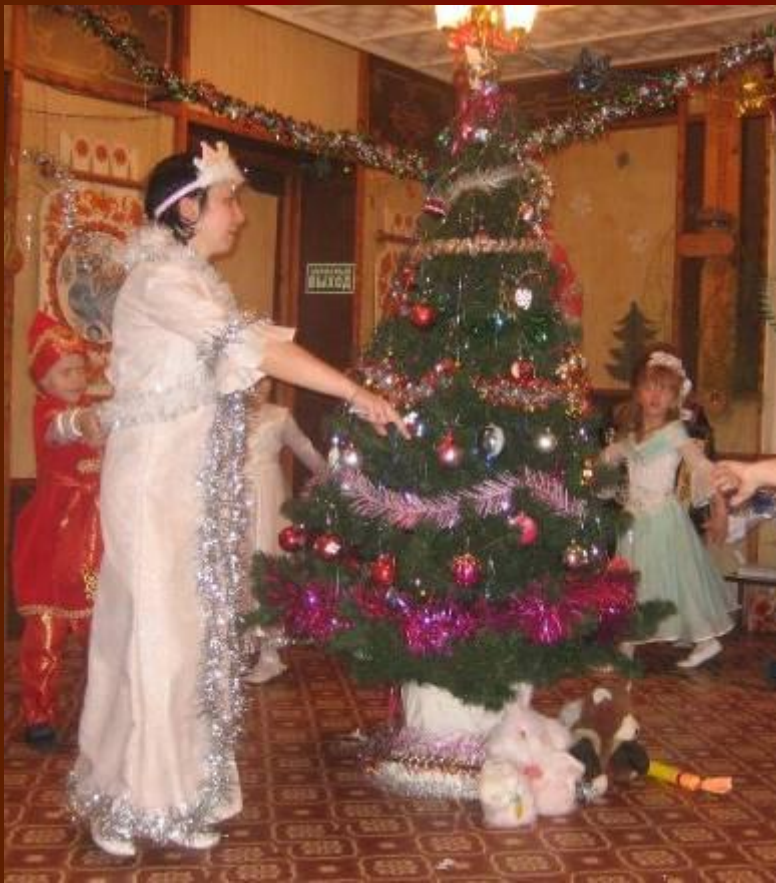
...и Снегурочка на утреннике ...