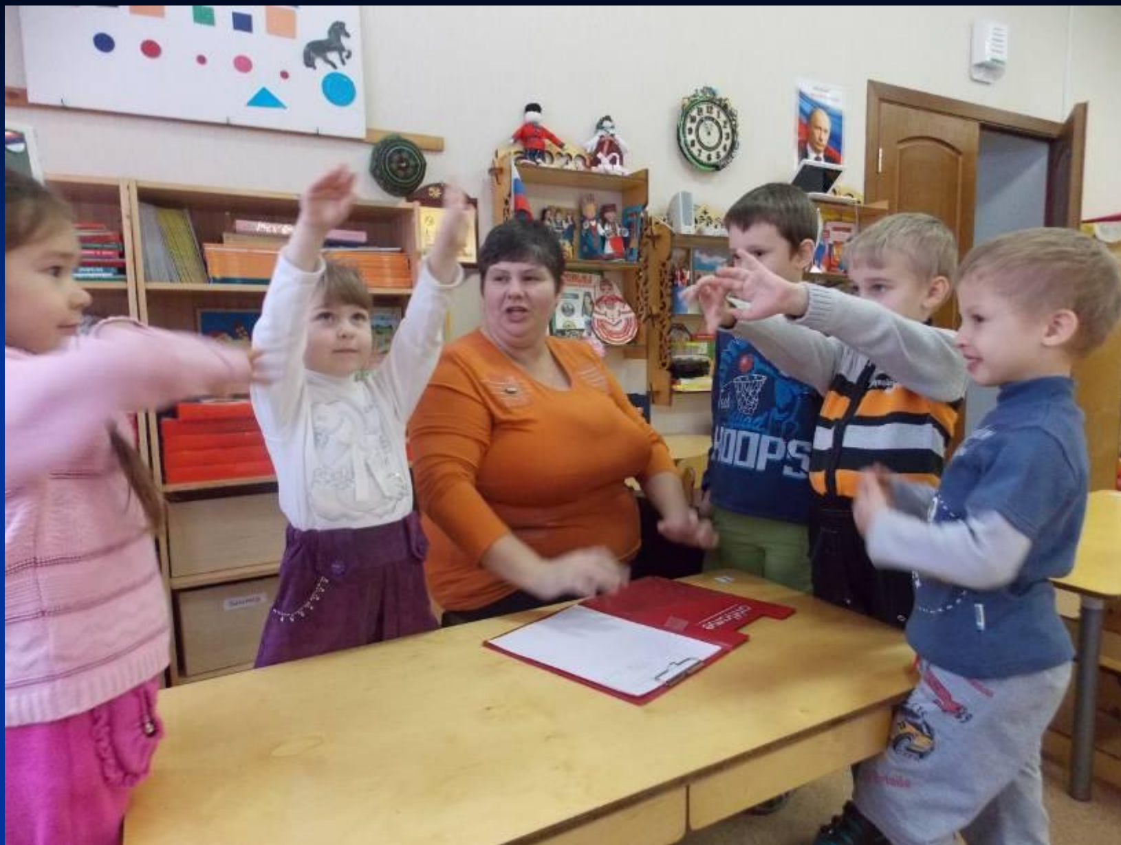
Составление рассказа о снежинке