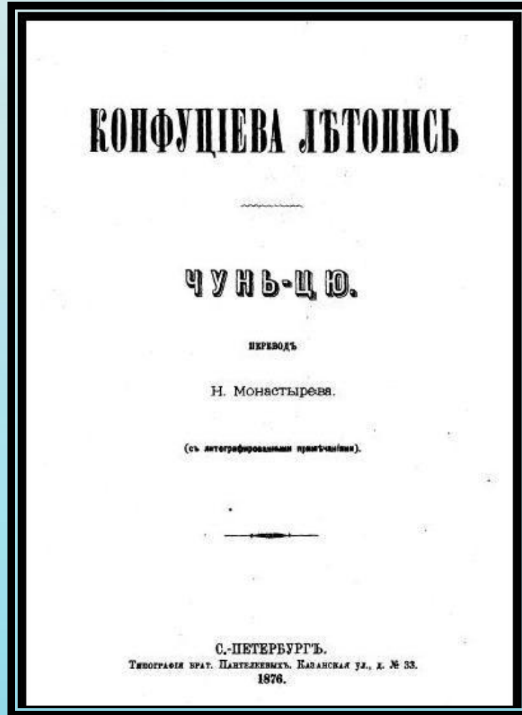
Чунь-цю. Конфуциева Летопись. Перевод Монастырева, 1876г.

«Чунь-цю» (春秋, «Весны и осени») - хроника древнекитайского государства Лу, охватывающая период Чуньцю (с 722 по 479 гг. до н. э.) Это древнейший китайский текст летописного плана. Согласно статистическому анализу, который провёл Д. В. Деопик, текст можно разделить на семь видов записей: «внешняя политика», «военная история», «быт монархов», «внутренняя политика», «экономика», «сакральное», «природные явления». Действующими лицами хроники являются монархи и вельможи 13 царств, а также племена ди.