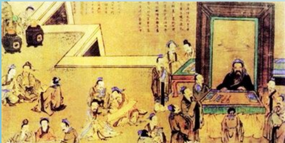
Конфуций в окружении учеников