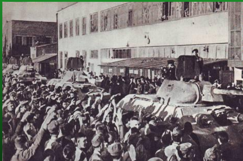
Танки с завода уходят на фронт

Сталинградский тракторный приступил к выпуску танковых моторов, артиллерийских тягачей и средних танков Т-34.