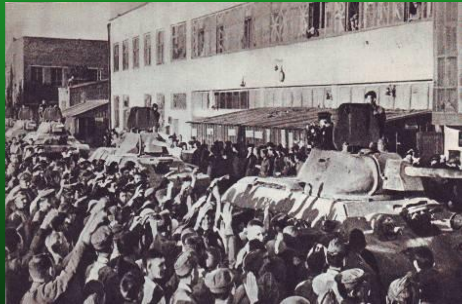
Танки с завода уходят на фронт

Сталинградский тракторный приступил к выпуску танковых моторов, артиллерийских тягачей и средних танков Т-34.