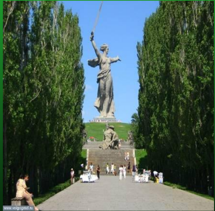
Мемориальный комплекс на Мамаевом кургане (современный вид)

Бои за курган начались 14 сентября 1942 года.