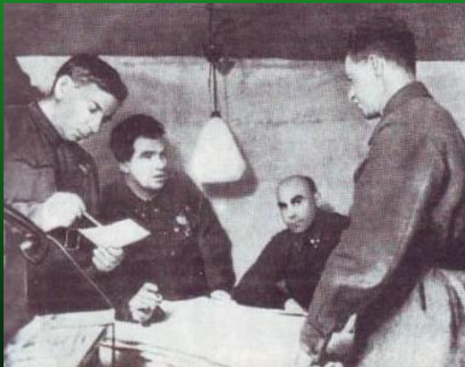
В штабе 62-й армии: Н.И.Крылов, В.И. Чуйков, К.А.Гуров, А.И.Родимцев

17 июля 1942 года передовые части фашистской группы армий «Б» в большой излучине Дона встретились с войсками Сталинградского фронта. Началась Сталинградская битва.