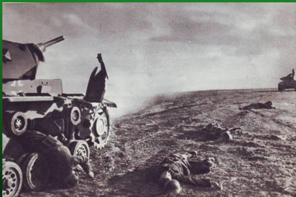
Атака немецких танков отбита

28 июля 1942 года Народный комиссар обороны СССР издал приказ № 227, вошедший в историю под названием «Ни шагу назад!»