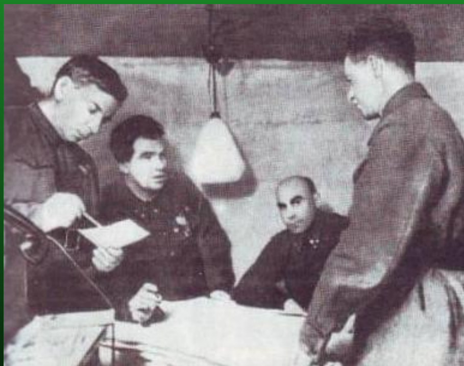
В штабе 62-й армии: Н.И.Крылов, В.И. Чуйков, К.А.Гуров, А.И.Родимцев

17 июля 1942 года передовые части фашистской группы армий «Б» в большой излучине Дона встретились с войсками Сталинградского фронта. Началась Сталинградская битва.