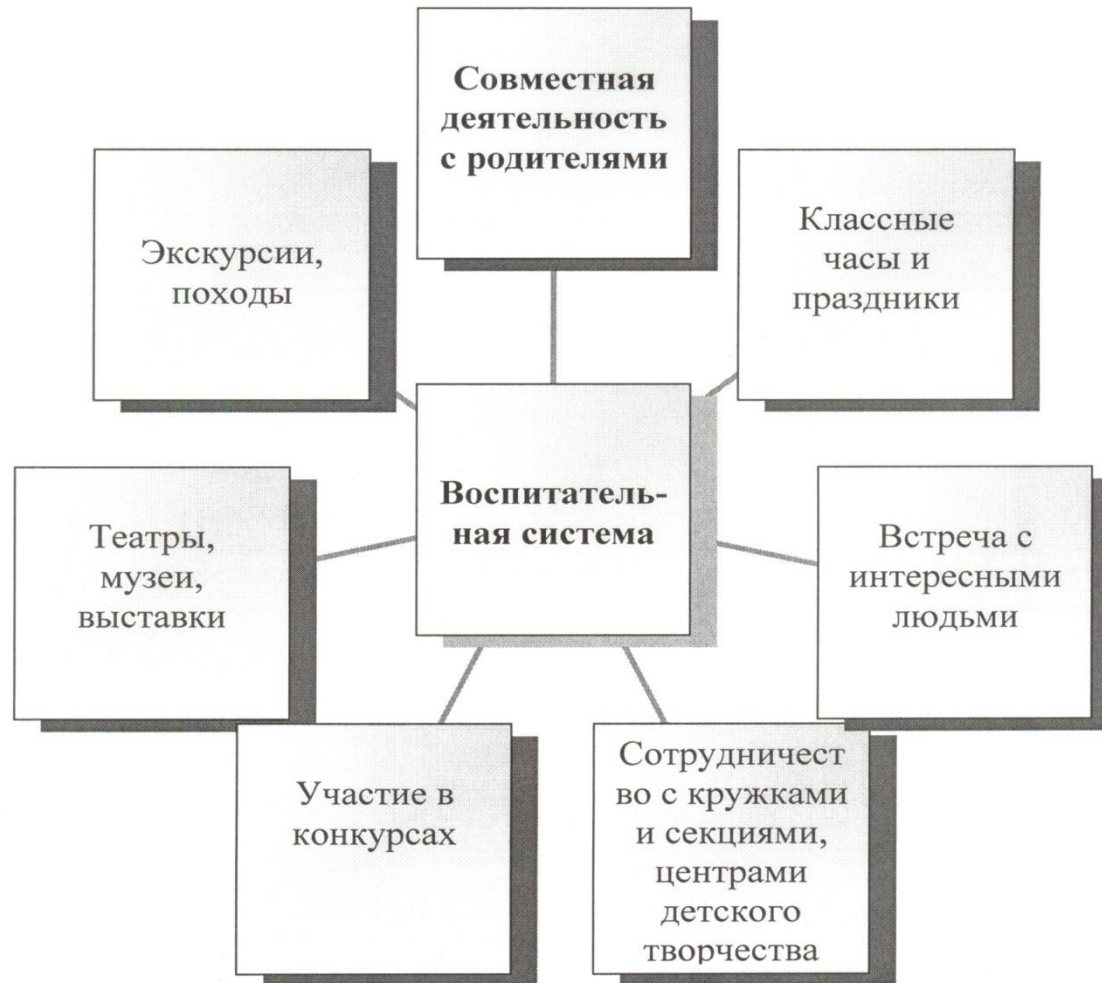
Схема реализации воспитательной системы через деятельность.

Главные направления учебно-воспитательной работы - нравственное и экологическое воспитание.