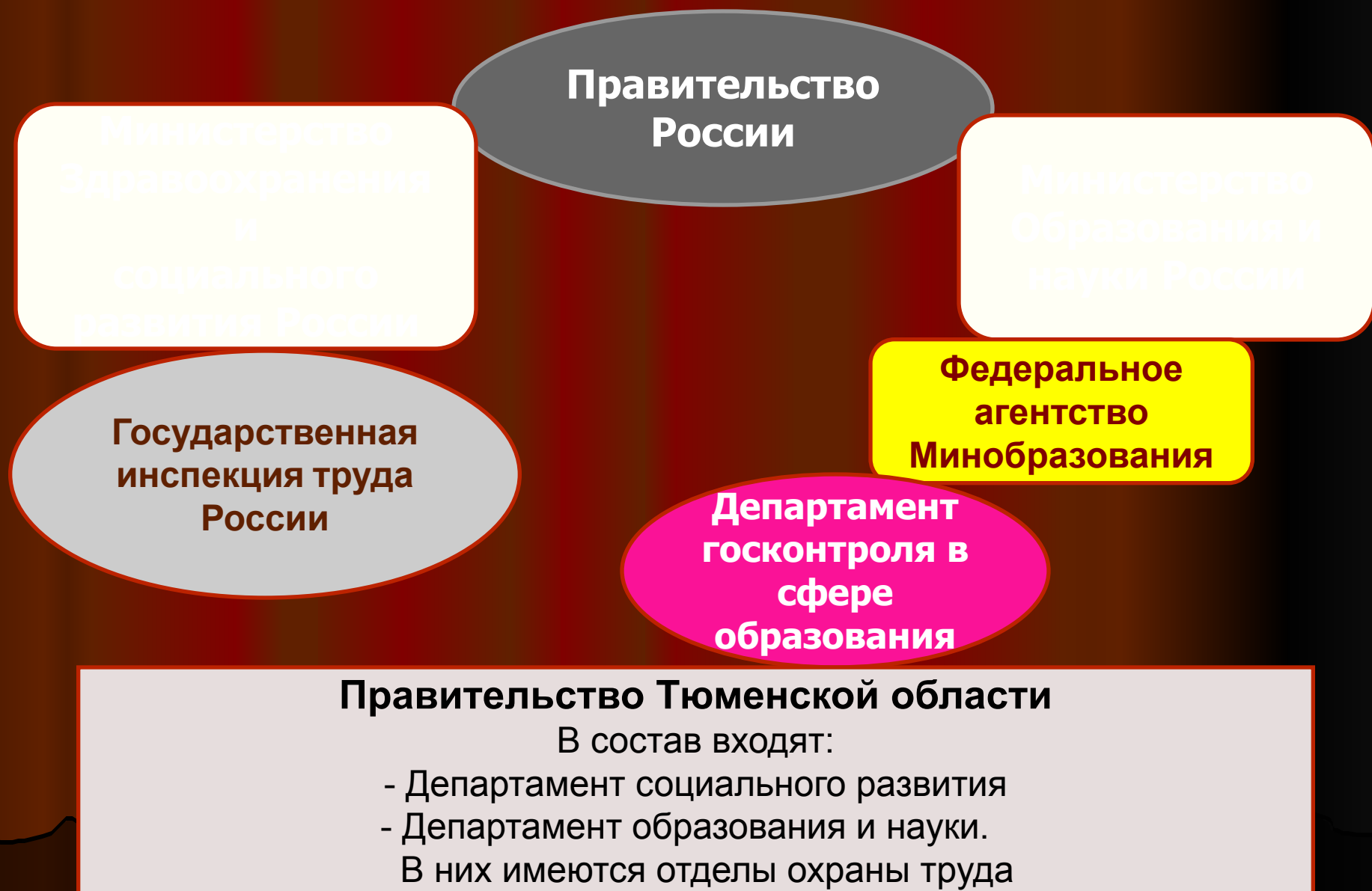
Схема государственного управления охраной труда