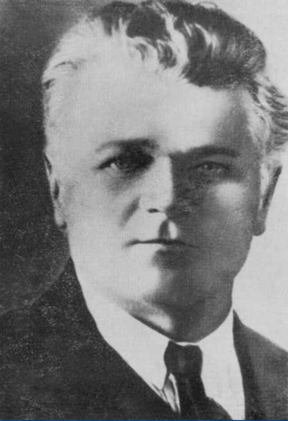
Станислав Тимофеевич Шацкий (1878 – 1934 гг.) советский педагог

На практике воплотил свою идею самоуправления школьников.