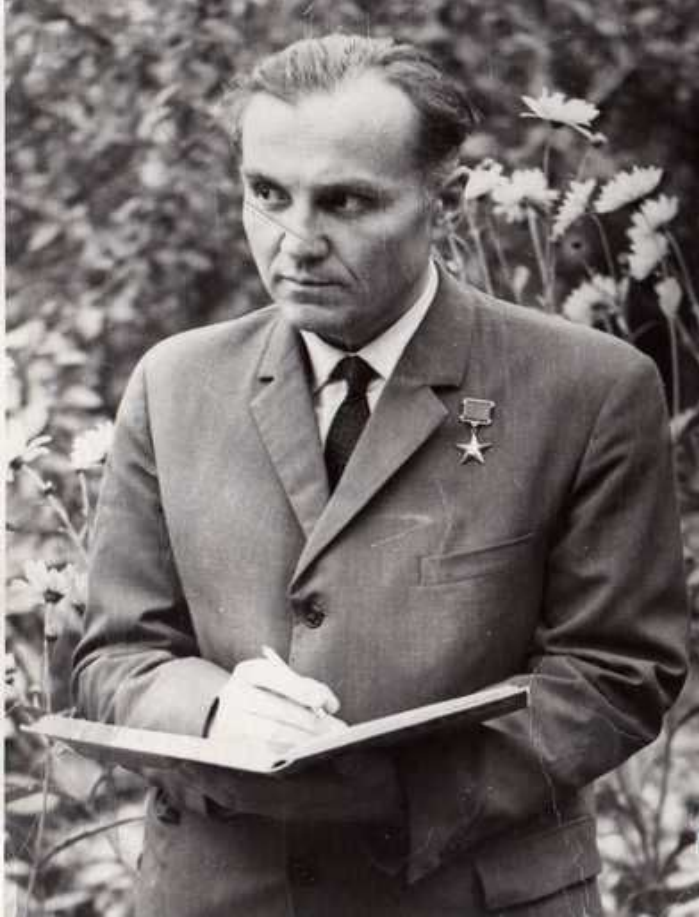
Василий Александрович Сухомлинский