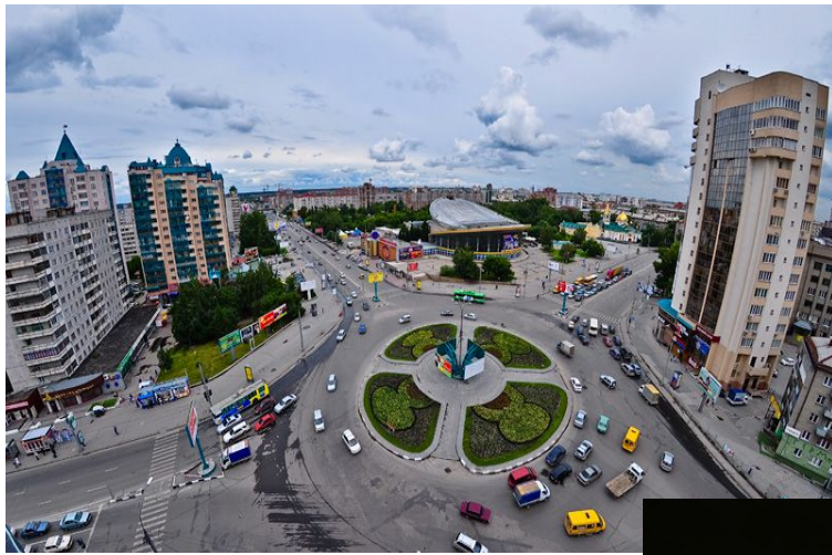
Пересечение улиц Челюскинцев (ранее Межениновская ) и Нарымской .