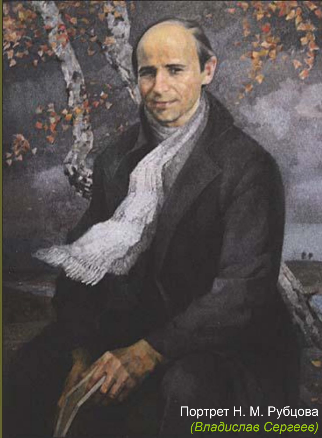
Портрет Н. М. Рубцова (Владислав Сергеев)