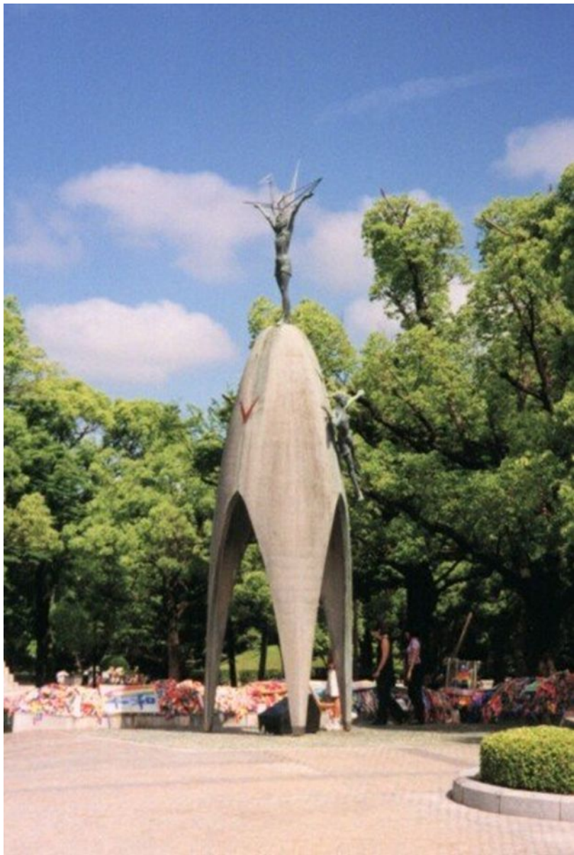
Памятник Садако Сасаки в городе Хиросима, Япония

Смерть Садако могла остаться незамеченной, как и сотни других смертей, наступивших после лучевой болезни. Но этому помешали её друзья и родственники. Все написанные ей в больнице письма были опубликованы, и по всей Японии начали собирать средства на проект памятника Садако – и всем детям, погибшим в результате ядерной бомбардировки. В 1956 году было опубликовано известно открытое письмо к Садако её матери, Саски Фуджико. Это был плач женщины, потерявшей ребёнка 5 мая 1958 года монумент был открыт.