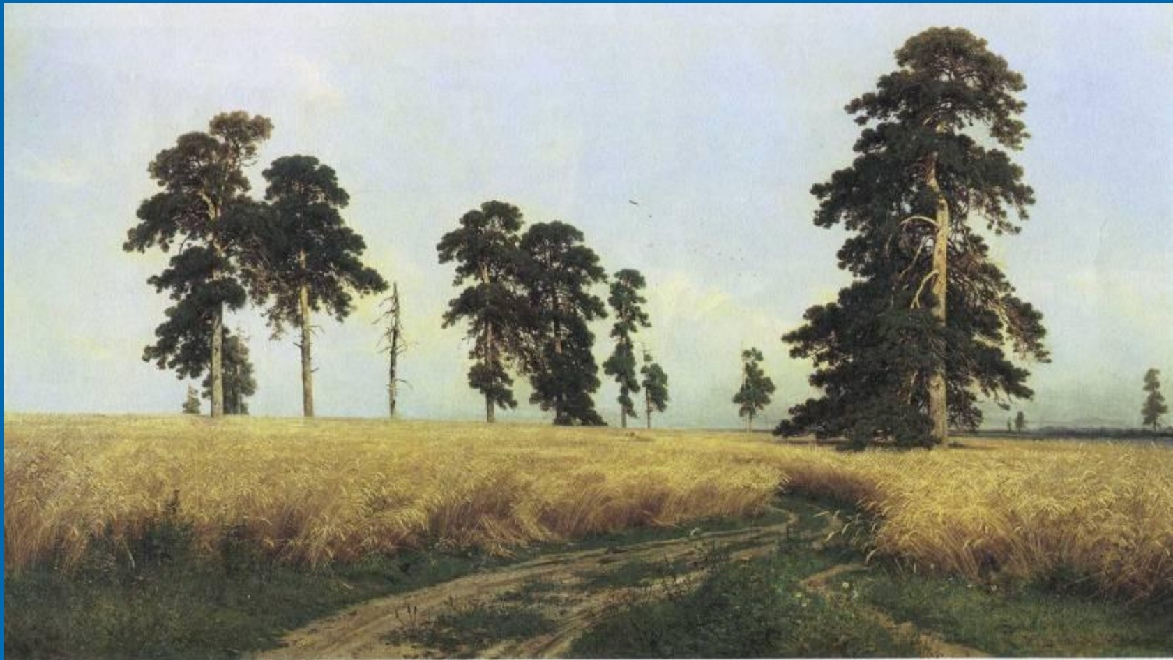
И.И Шишкин «Рожь»