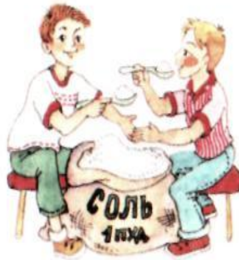
Пуд соли съесть