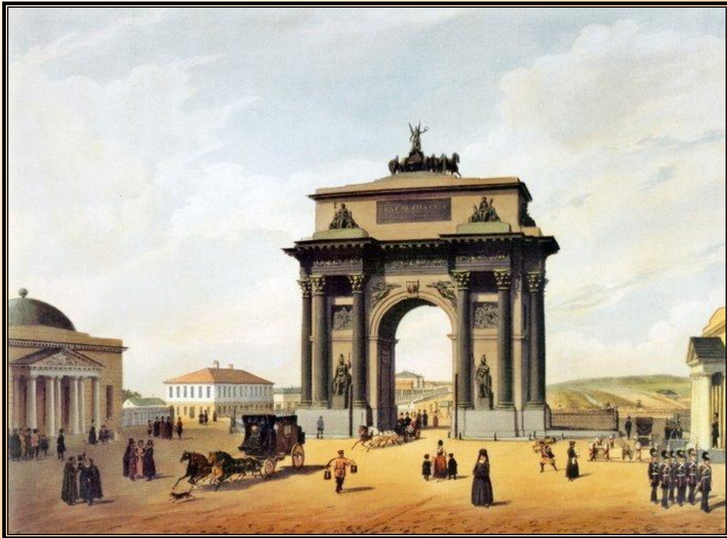
Тверская застава и Триумфальные ворота в 1848 году. Рис. Ф. Бенуа