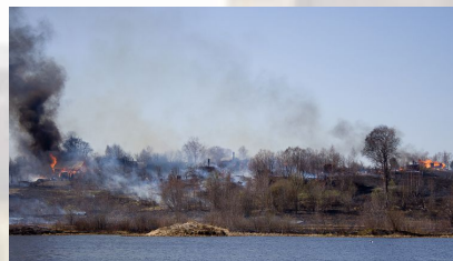
И дым Отечества нам сладок и приятен!