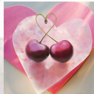
любви все возрасты покорны.