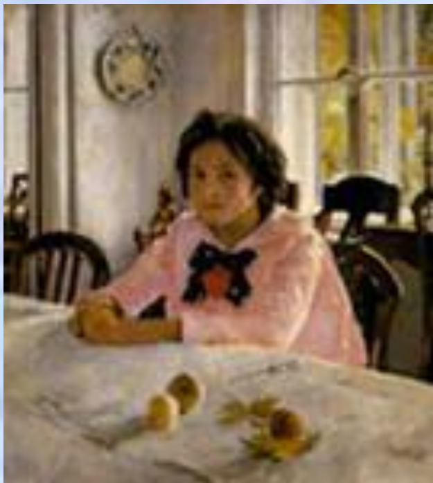
В. А. Серов «Девочка с персиками»

На другой день поутру я только что стал одеваться, как дверь отворилась и ко мне вошел молодой офицер невысокого роста, с лицом смуглым и отменно некрасивым, но чрезвычайно живым (А. С. Пушкин «Капитанская дочка»)