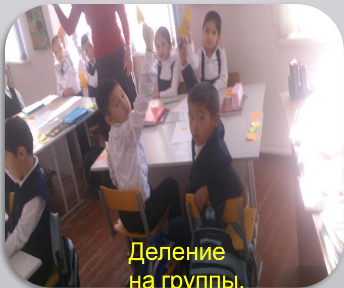
Деление на группы.