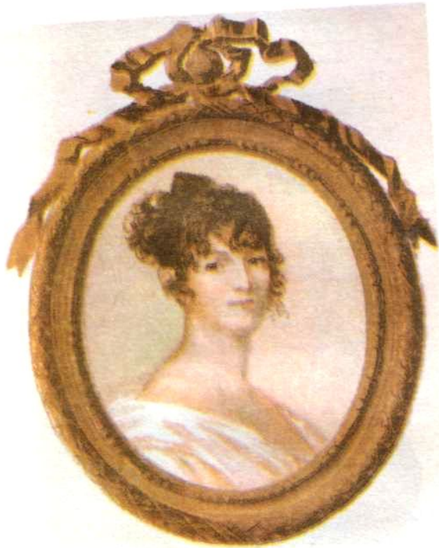
Надежда Осиповна Пушкина. Миниатюра Ксавье де Местра. 1810