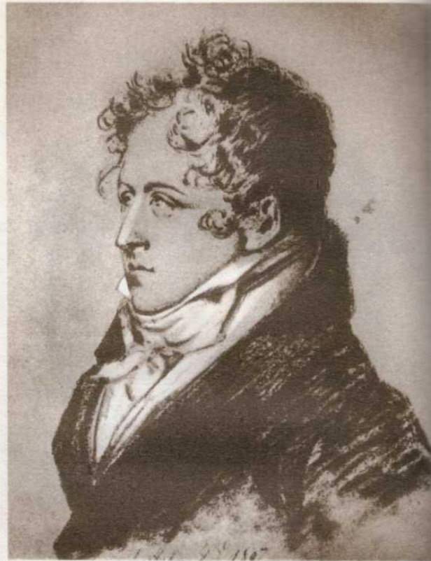
Сергей Львович Пушкин. Карандашный портрет Сент-Обена. 1807.