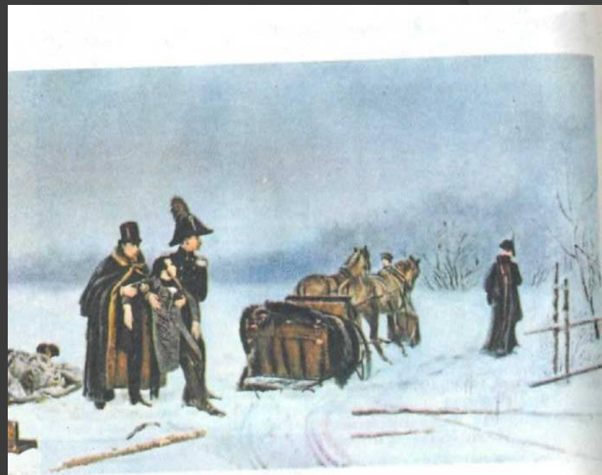
Дуэль Пушкина с Дантесом. Картина работы А. А. Наумова. 1885.

Короткий зимний день уже клонился к вечеру, когда Пушкин и его секундант К. К. Данзас отправились на Черную речку — недалекий пригород Петербурга, где была назначена дуэль.