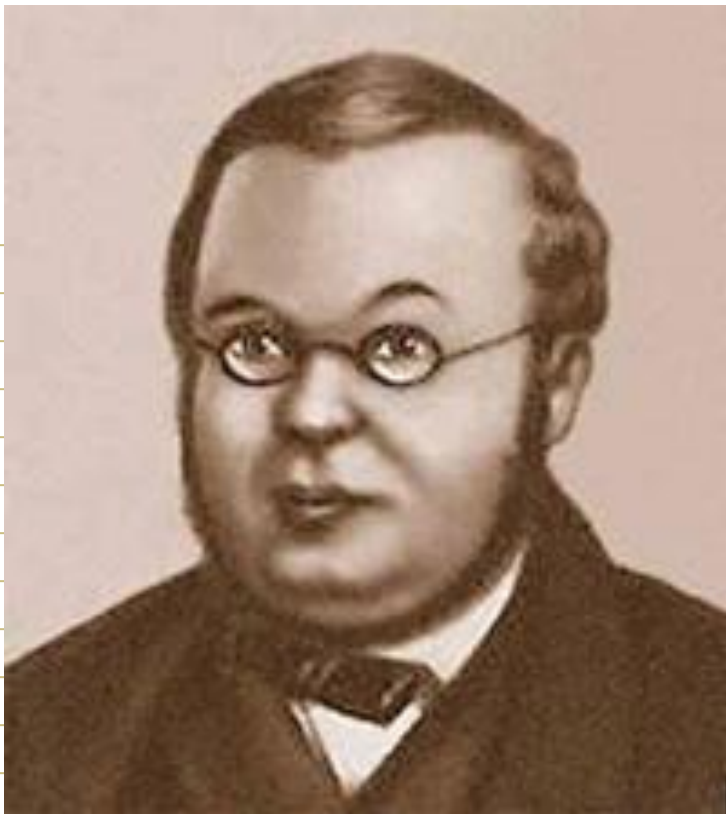
Петр Павлович Ершов