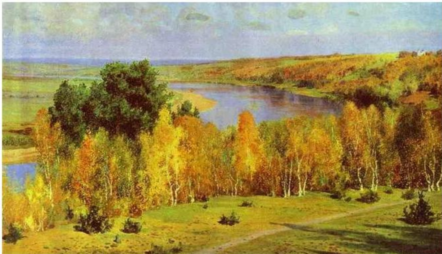
Золотая осень. Василий Polenov