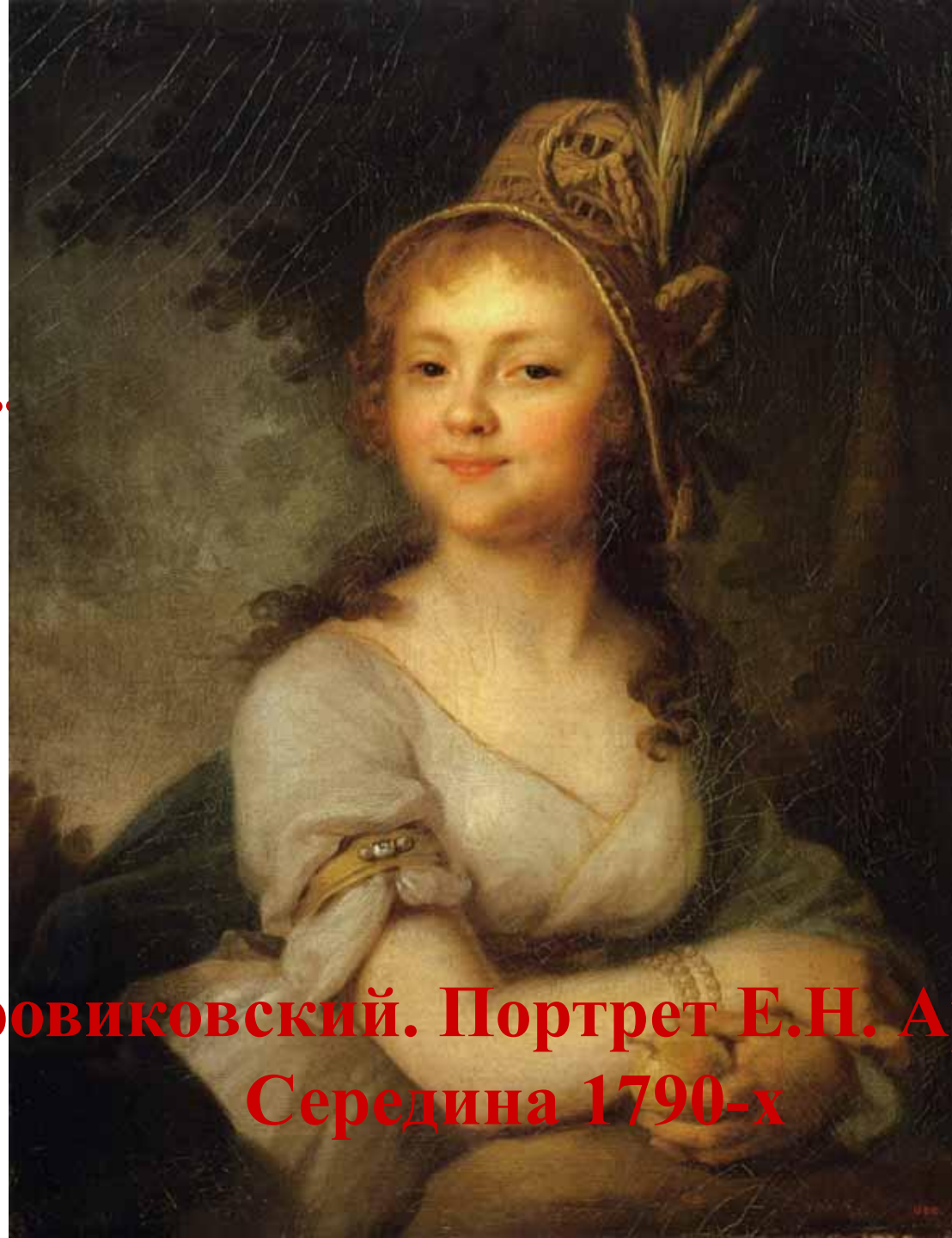
В.Л. Боровиковский. Портрет Е.Н. Арсеньевой. Середина 1790-х