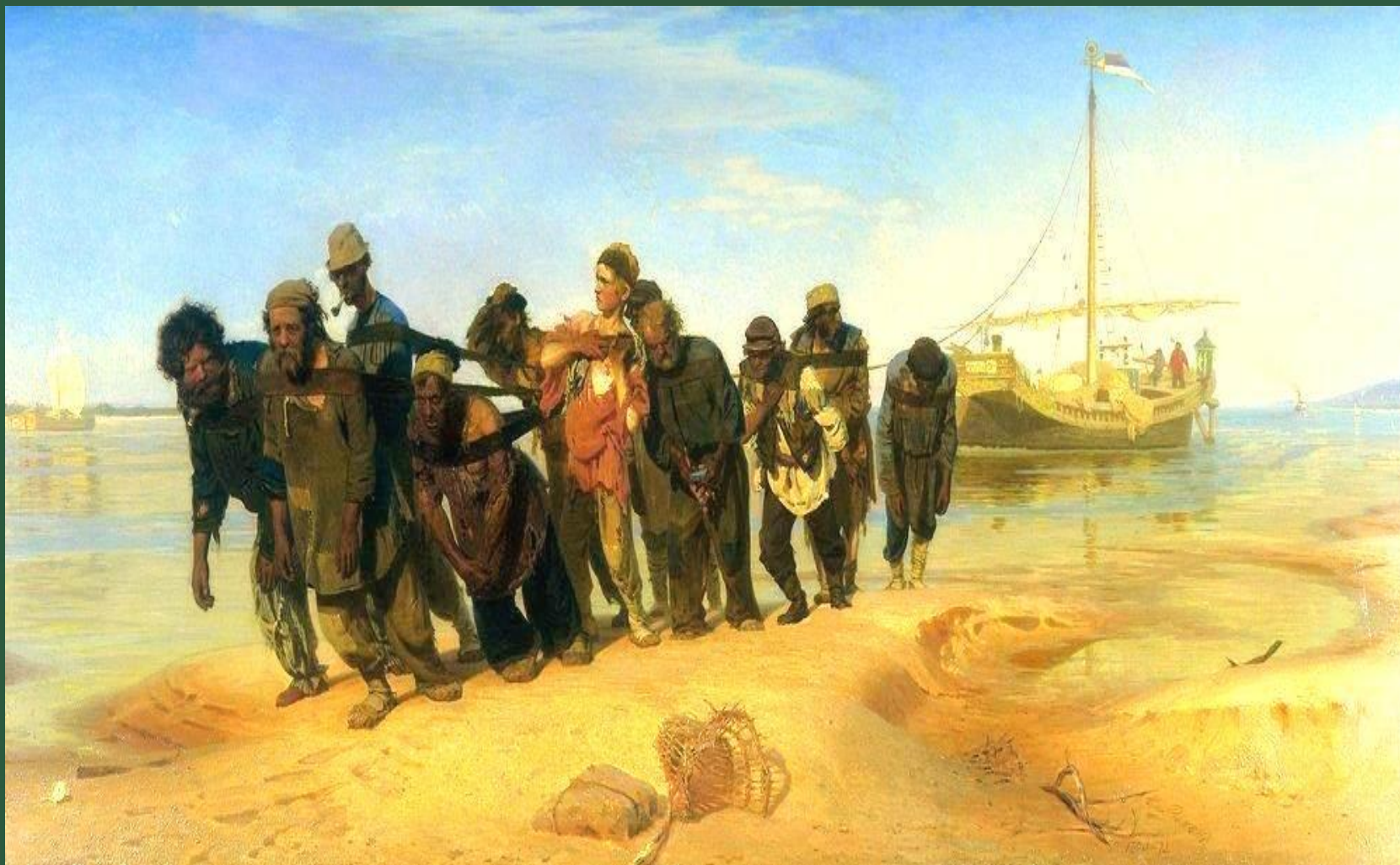
И. Е. Репин «Бурлаки на Волге» . Государственный Русский музей, Санкт-Петербург