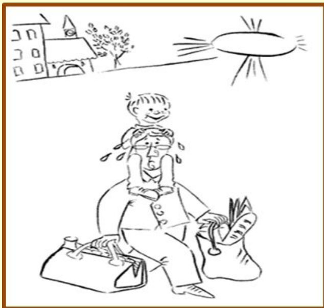
Сесть на шею