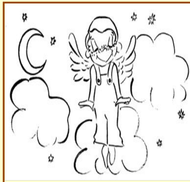
Витать в облаках