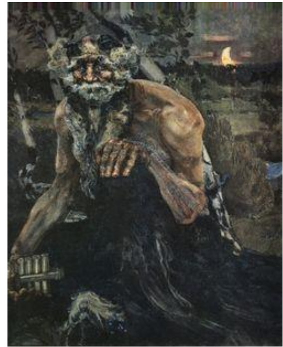
М. Врубель «Пан»