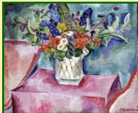
Цветы на розовом