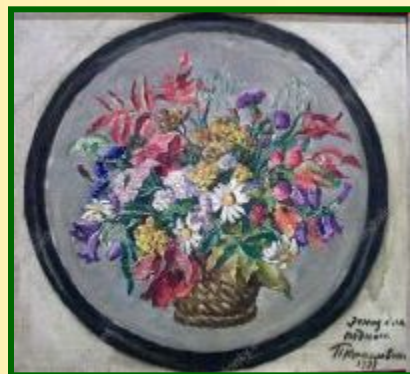
Осенний букет в корзине