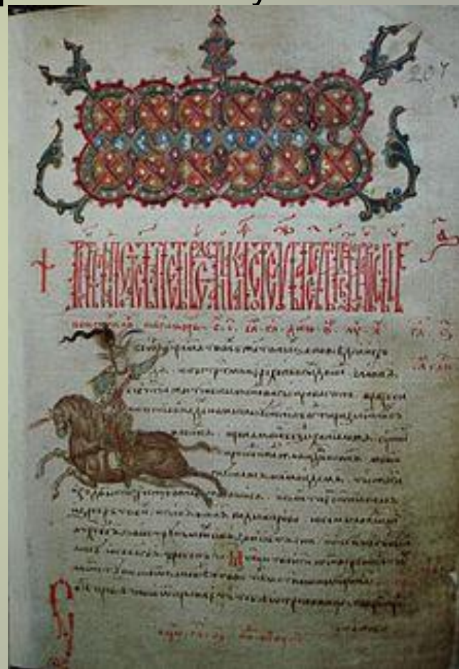
Имя учёного носит Буслаевская псалтирь XV века

В работе «Перехожие повести» (1874, опубликована в сборнике «Мои досуги», 1886) развивал идеи немецкого учёного Т. Бенфея о заимствованиях сюжетов и мотивов европейского фольклора с Востока. Занимался изданием древних рукописей и изучением икон