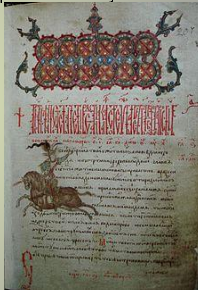
Имя учёного носит Буслаевская псалтирь XV века

В работе «Перехожие повести» (1874, опубликована в сборнике «Мои досуги», 1886) развивал идеи немецкого учёного Т. Бенфея о заимствованиях сюжетов и мотивов европейского фольклора с Востока. Занимался изданием древних рукописей и изучением икон