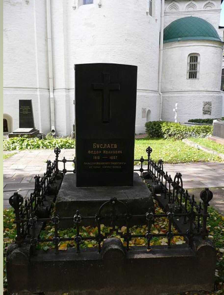
Памятник на могиле Буслаева в Новодевичьем монастыре

В конце жизни Буслаев начал слепнуть, он вынужден был отказаться от своей научной работы. Это сразу отразилось на его состоянии, он стал постепенно слабеть и угасать. Один из его друзей, видя это, предложил ему продиктовать биографию. Так появилась книга Федора Ивановича Буслаева «Мои воспоминания».