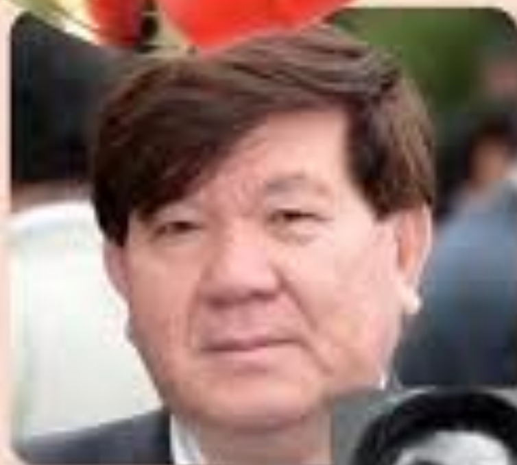
Мұхтар ШАХАНОВ, ақын, ҚР Халық жазушысы