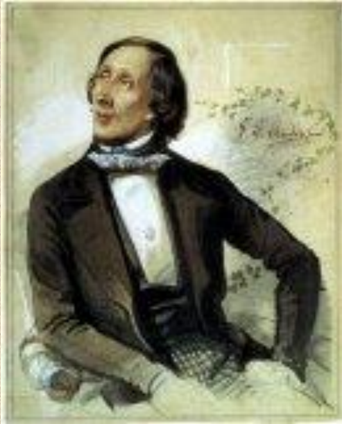
Ганс Христиан Андерсен - известный датский сказочник,