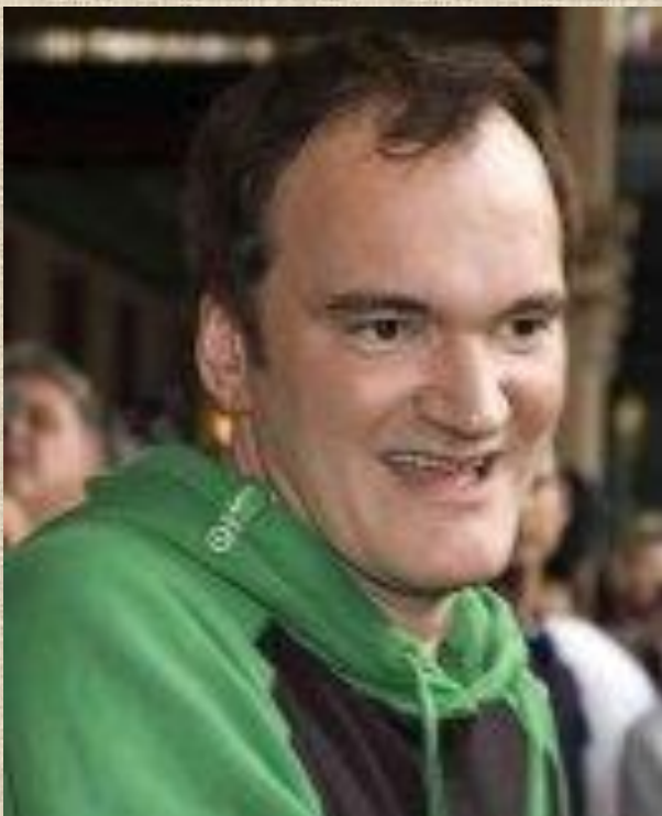
Квентин Тарантино великий режиссер, сценарист, продюсер, неоднократно выдвигался на премию «Оскар»