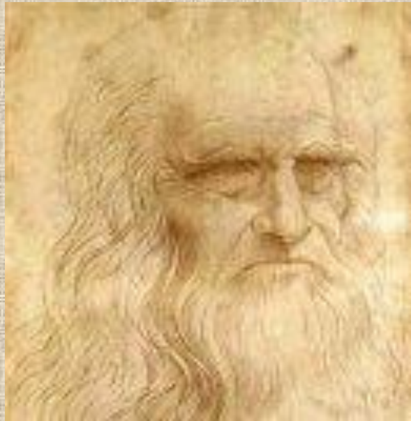
Леонардо Да Винчи - титан Эпохи Возрождения, живописец, скульптор, архитектор, учённый и инженер.