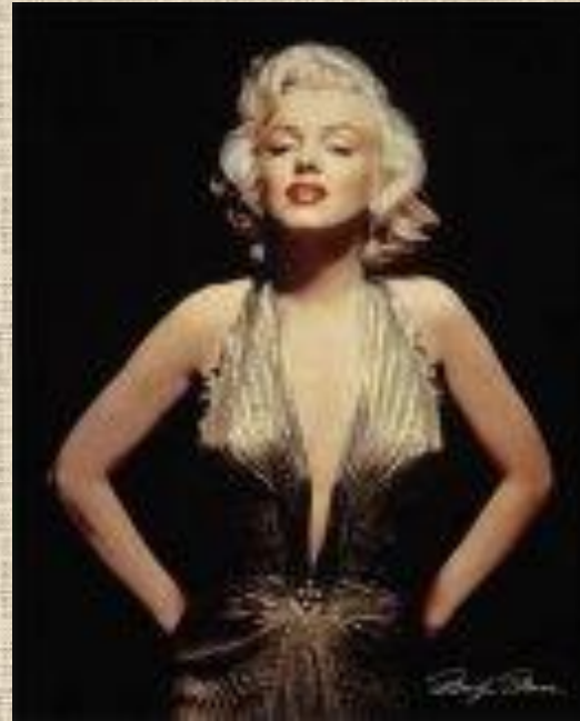
Мерилин Монро известная американская актриса, легенда при жизни и легенда после смерти.