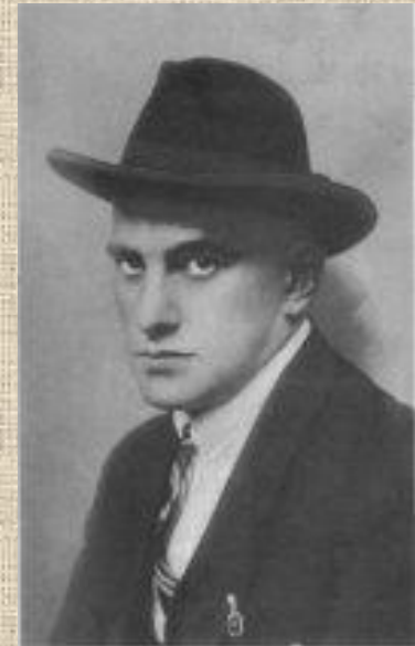
Владимир Маяковский - великий поэт своего времени, агитатор, "горлан", поэт Революции.