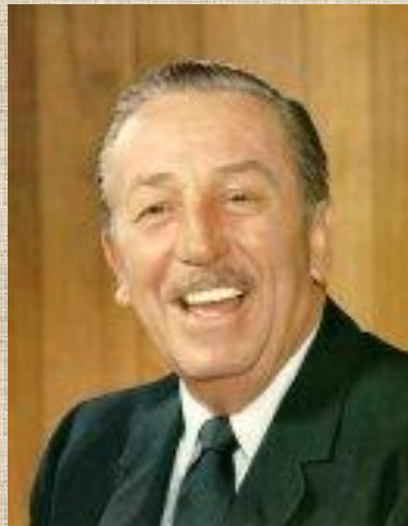
Уолт Дисней американский кинорежиссёр, продюсер, художник- мультипликатор, талантливый бизнесмен.