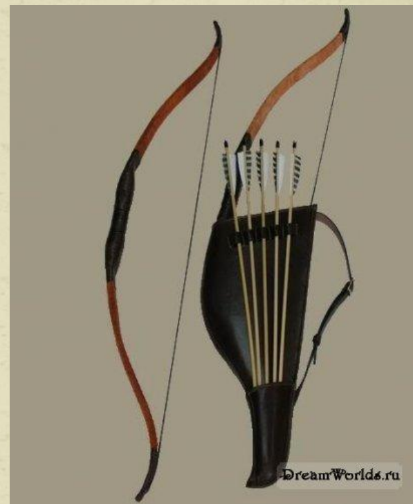
Лук. Колчан со стрелами