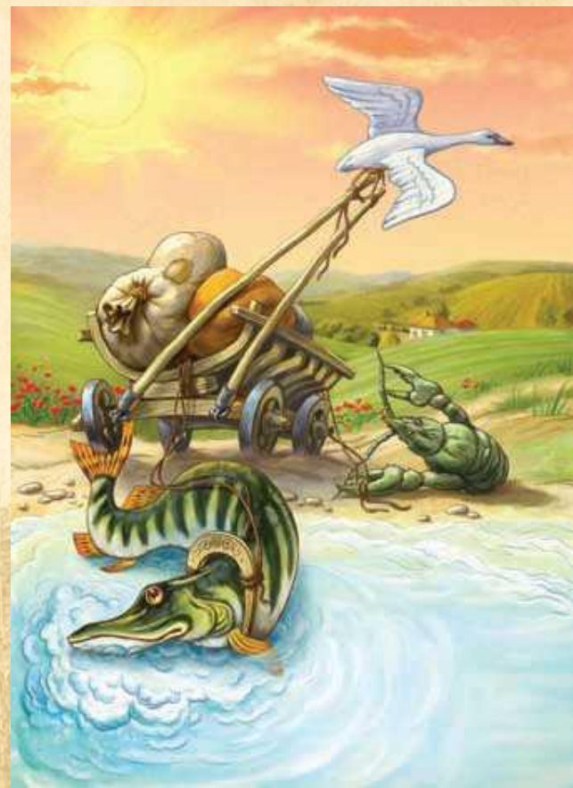
«Лебедь, Рак и Щука»