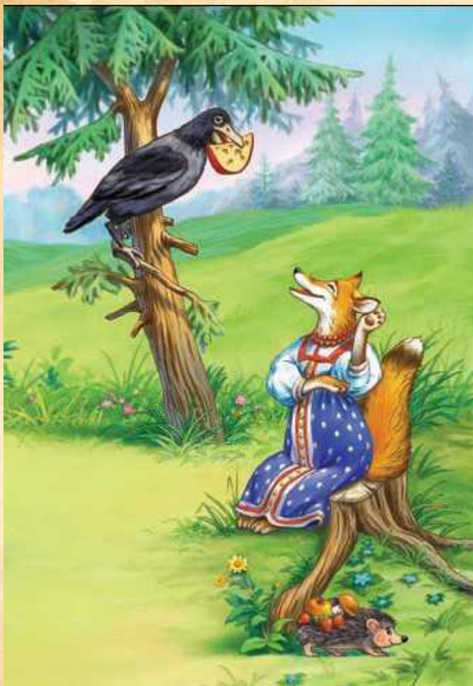
«Ворона и лисица»