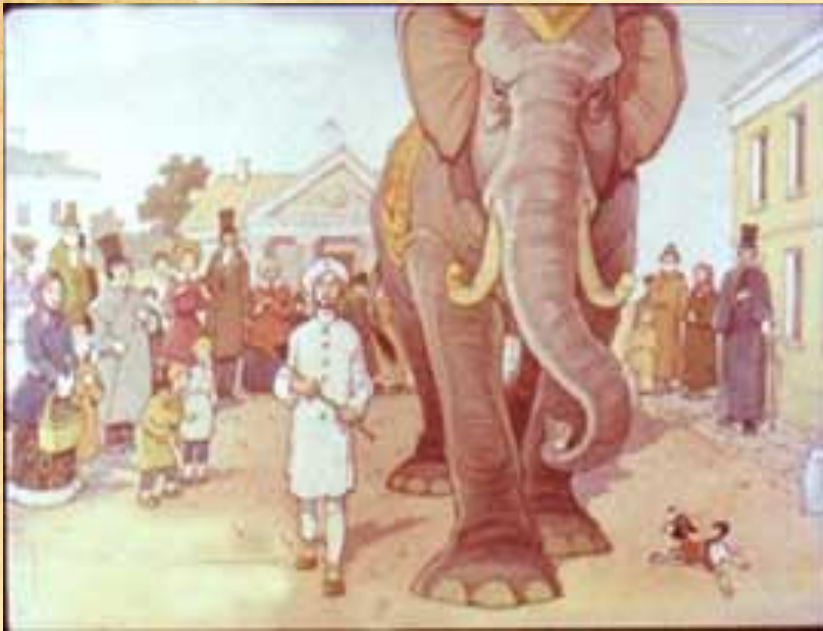
«Слон и Моська»