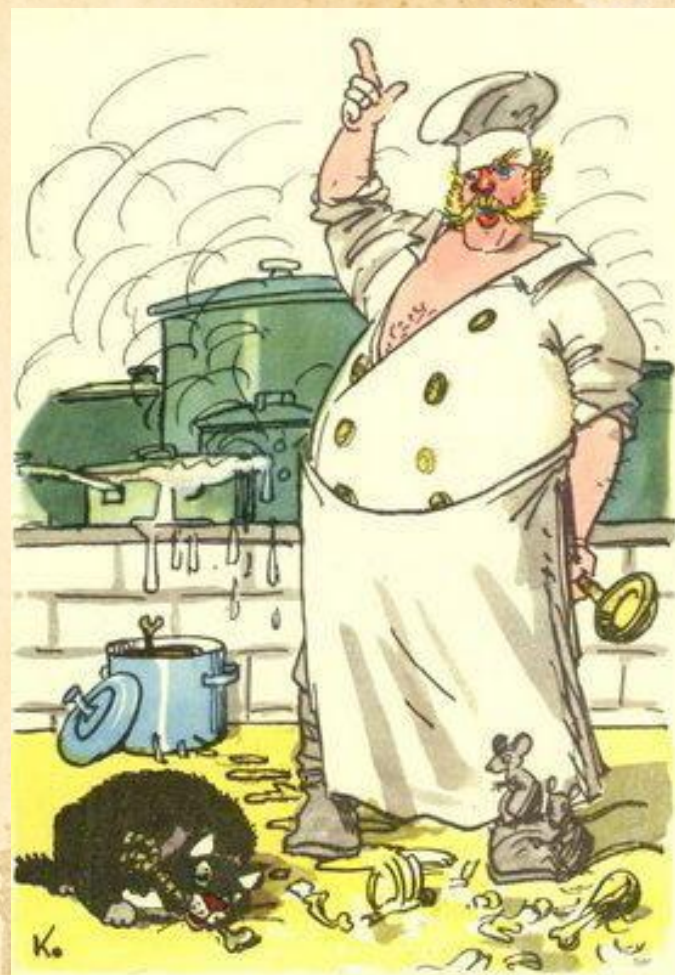
«Кот и повар»