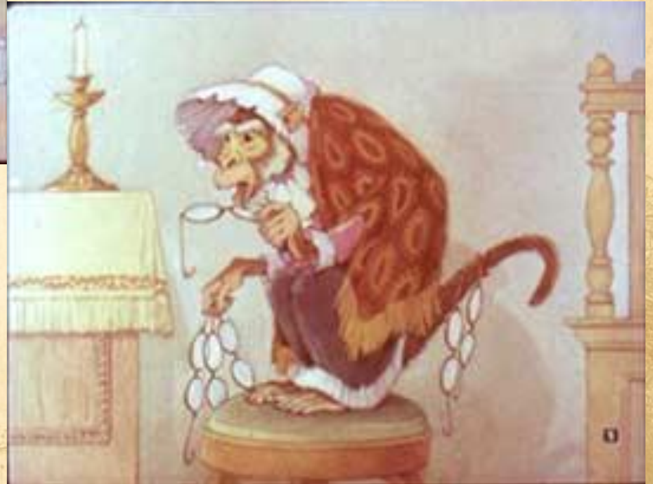
«Мартышка и очки»