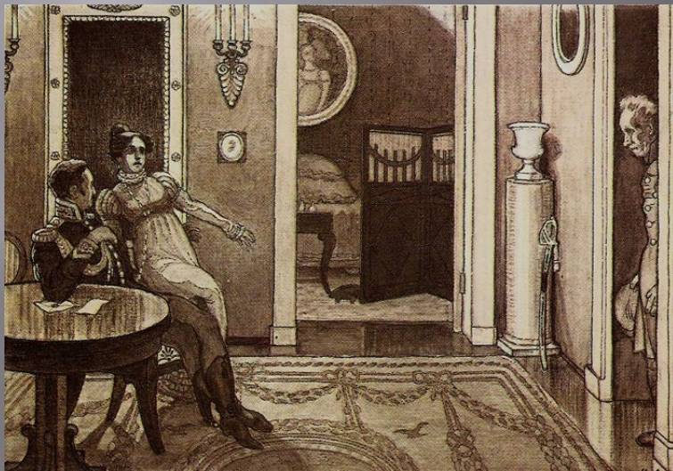
Иллюстрация М. В. Добужинского