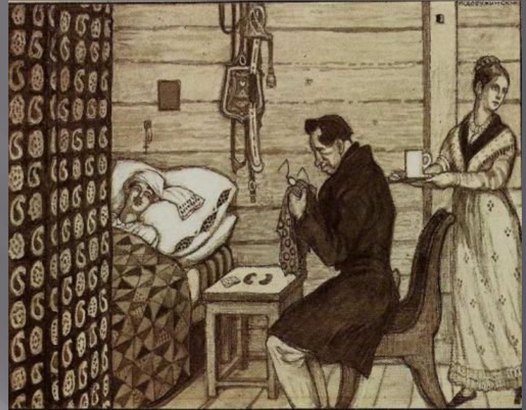
Иллюстрация М. В. Добужинского