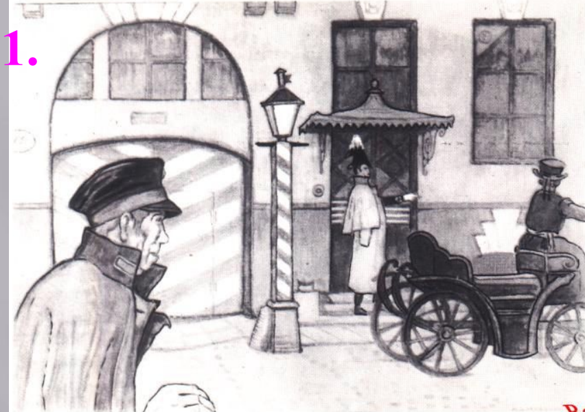
Иллюстрация М. В. Добужинского