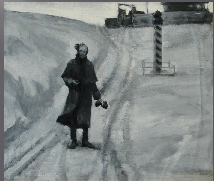
Иллюстрация Игоря Панова