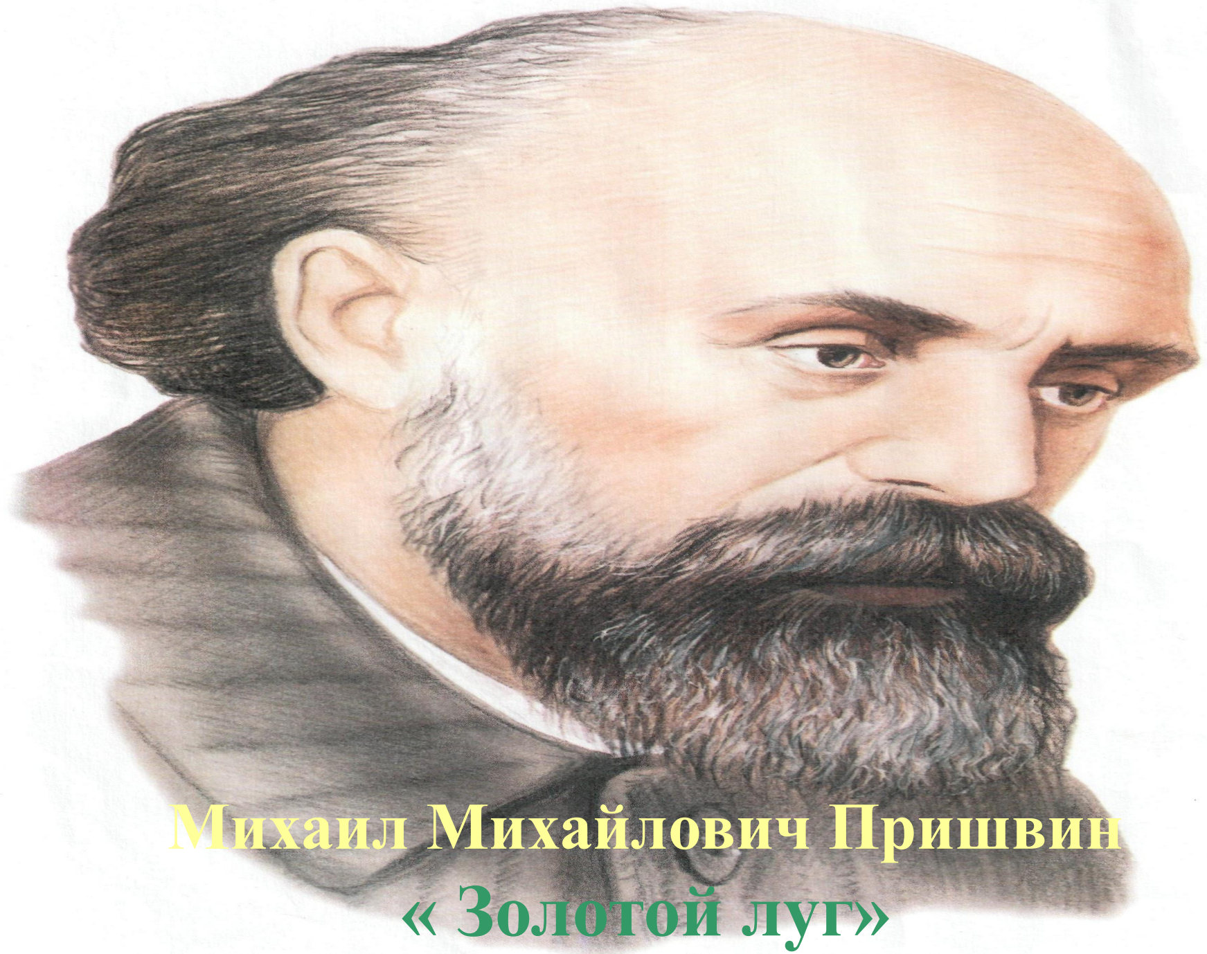
Михаил Михайлович Пришвин «Золотой луг»