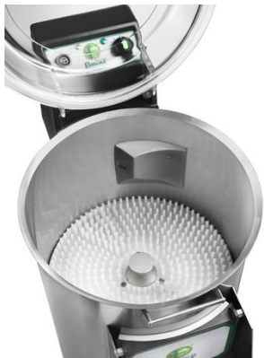
Машина для чистки мидий Fimar LCF/10M

Раковины открывают, вынимают из них мясо и еще раз промывают в кипяченой воде. Варено-мороженые мидии оттаивают на воздухе или в воде и промывают.