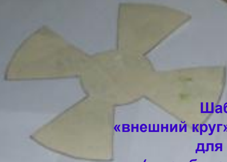
Шаблоны «внешний круг» и «внутренний круг» для цветка ( цвет бумаги по выбору)