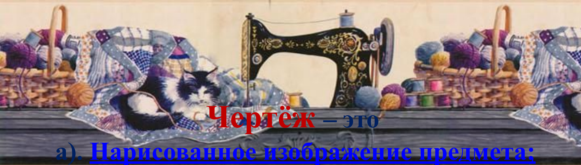
Чертёж – это