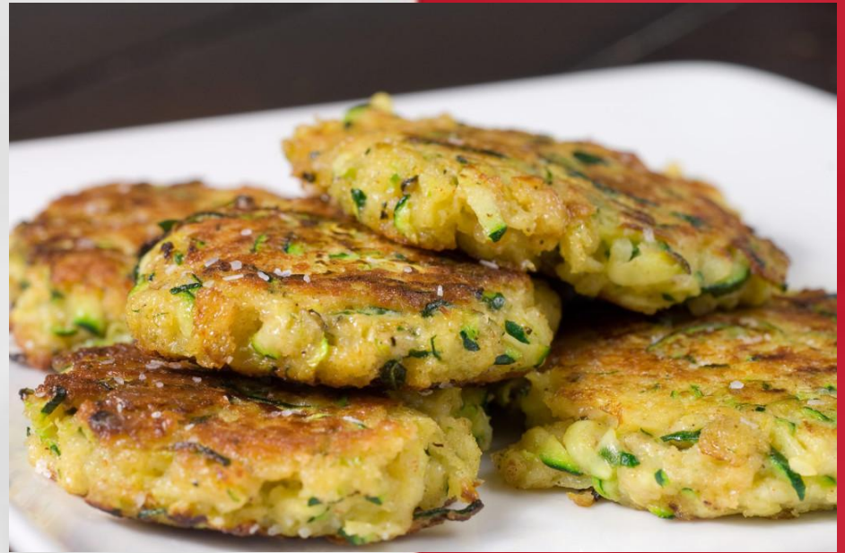
Оладьи из кабачков цуккини с цветами