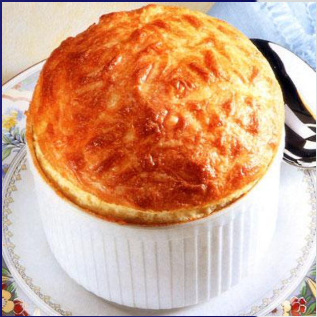
Суфле с сыром