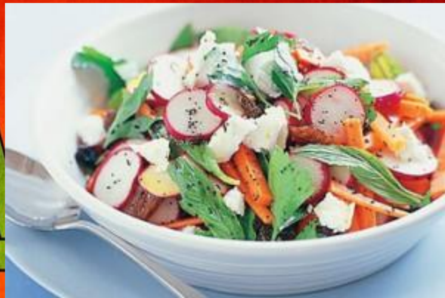
Салат из моркови и редиса

Перемешать огурец с остальными ингредиентами для салата и с заправкой, приправить и добавить кориандр.