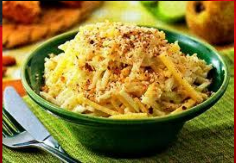
Бранденбургский сырный салат

Салат полить заправкой и посыпать рубленым миндалем.