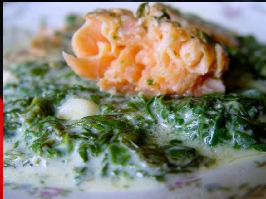
Сёмга со шпинатом

На дно формы выкладывается шпинат готовый в кубиках (для удобного порционирования) с сыром фета. Положить мелко нарезанный зелёный лук и налить немного воды, чтобы прикрыть доньщко. Сверху выложить филе красной рыбы посоленное, поперчённое по вкусу и поставить в разогретую до 180 градусов на 40 минут.