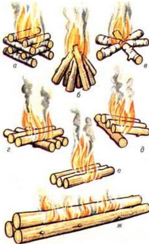
Рис. 1. Типы костров: а — «колодец»; б — «шалаш»; в — «звездный»; г, д и е — «таёжный»; ж — «нодья».