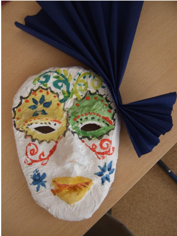
Работы учеников 6 класса