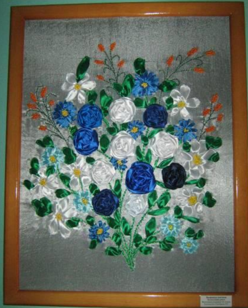
Embroidery of a bouquet of flowers by the artist [Name] [Additional text]