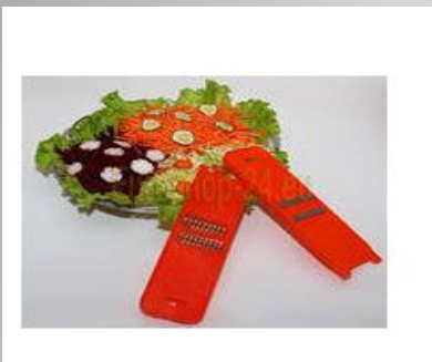
терка для соломки