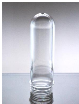
Преформа 65 гр.