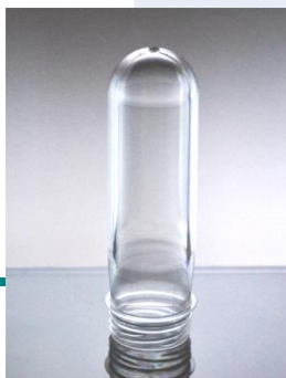
Преформа 65 гр.