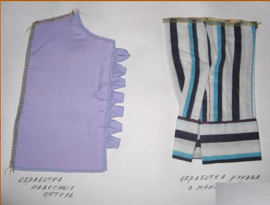
ОБРАБОТКА НАВЕСНЫХ ЦЕТЕЛЬ