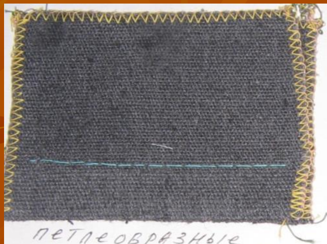
петлеобразные стежки (стачивающая) строчка